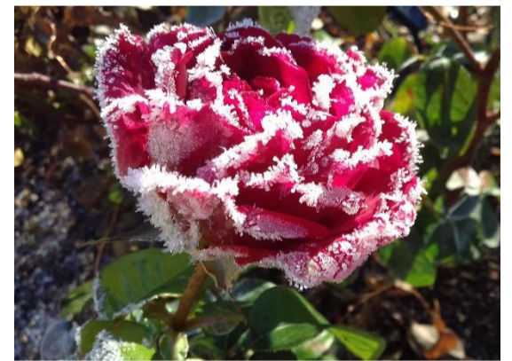
Agnius Zaleckis, 5kl.