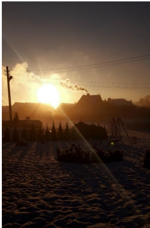
Neila Višpulskaitė, 5kl.